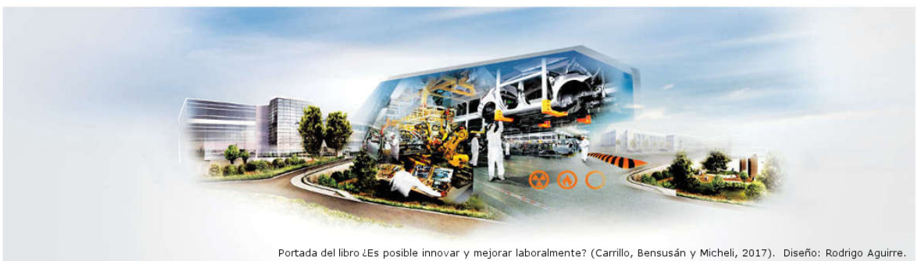
Portada del libro ¿Es posible innovar y mejorar laboralmente? (Carrillo, Bensusán y Micheli, 2017). Diseño: Rodrigo Aguirre.