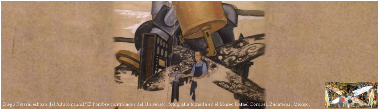
Diego Rivera, esbozo del futuro mural "El hombre controlador del Universo", fotografía tomada en el Museo Rafael Coronel, Zacatecas, México.