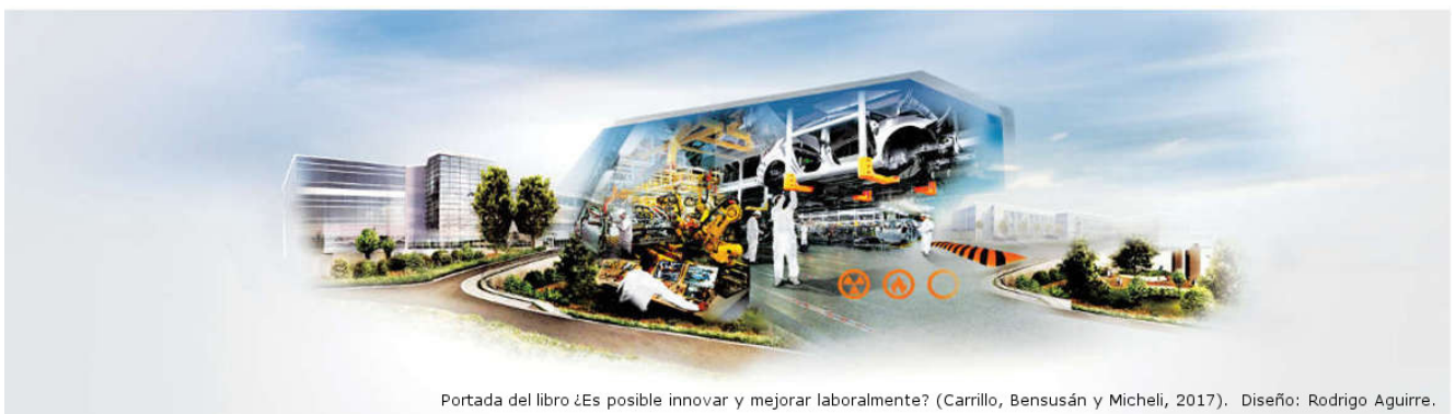
Portada del libro ¿Es posible innovar y mejorar laboralmente? (Carrillo, Bensúsán y Micheli, 2017). Diseño: Rodrigo Aguirre.