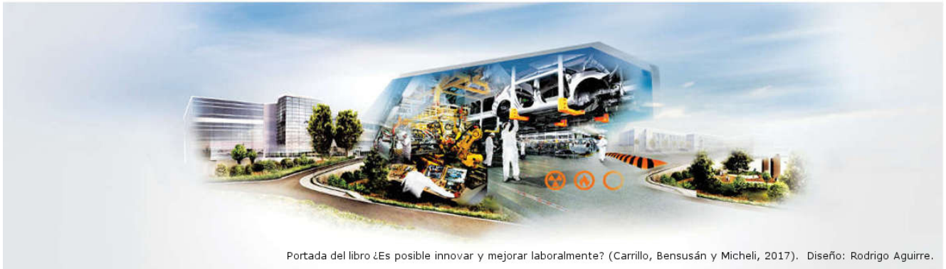
Portada del libro ¿Es posible innovar y mejorar laboralmente? (Carrillo, Bensusán y Micheli, 2017). Diseño: Rodrigo Aguirre.