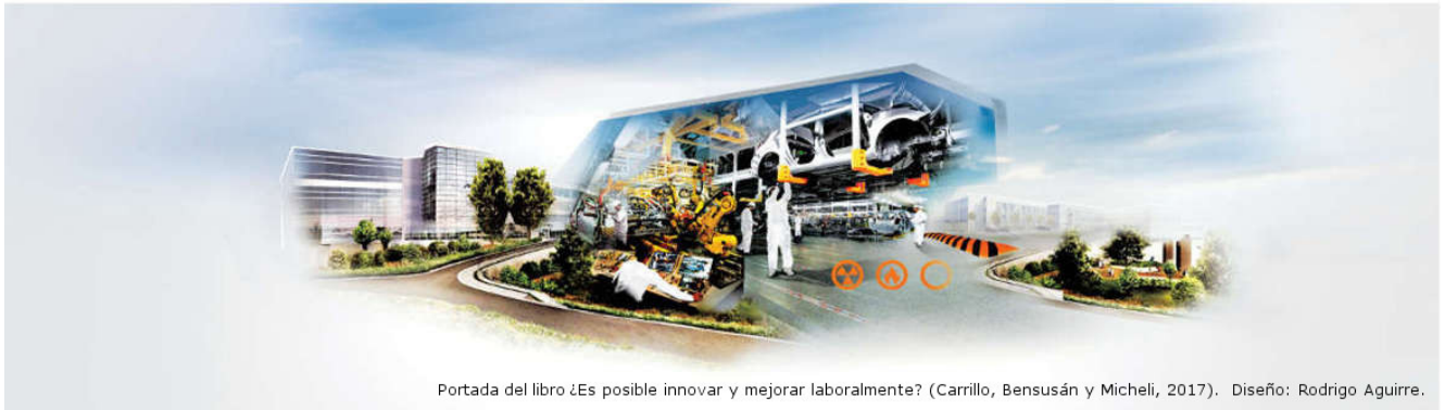
Portada del libro ¿Es posible innovar y mejorar laboralmente? (Carrillo, Bensusán y Micheli, 2017). Diseño: Rodrigo Aguirre.