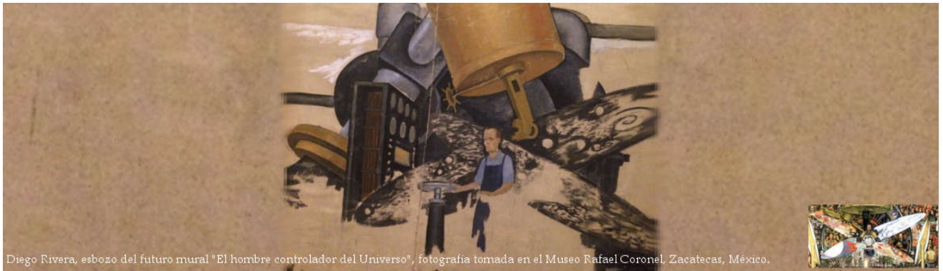
Diego Rivera, esbozo del futuro mural "El hombre controlador del Universo", fotografía tomada en el Museo Rafael Coronel, Zacatecas, México.