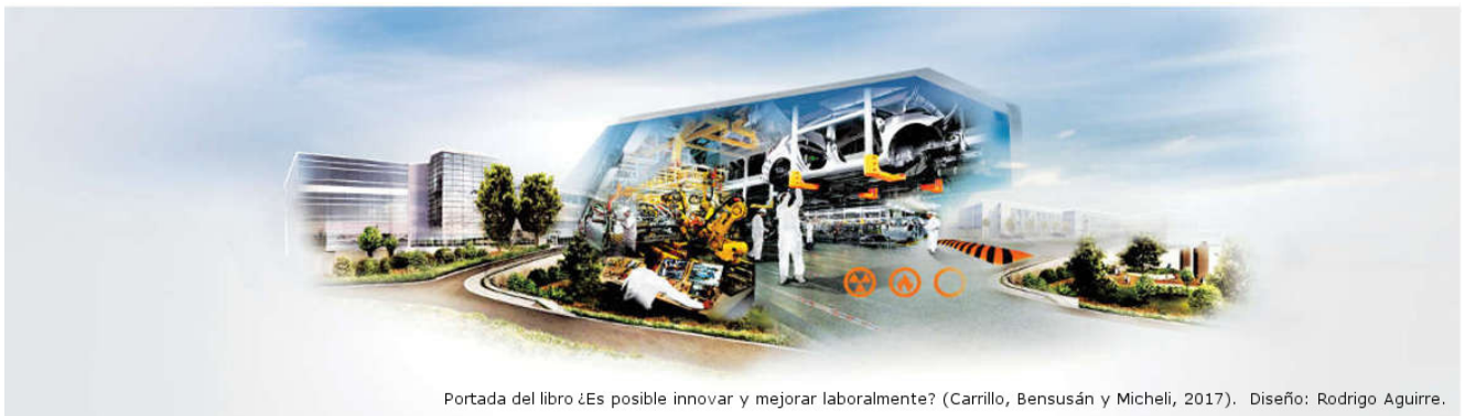
Portada del libro ¿Es posible innovar y mejorar laboralmente? (Carrillo, Bensusán y Micheli, 2017). Diseño: Rodrigo Aguirre.