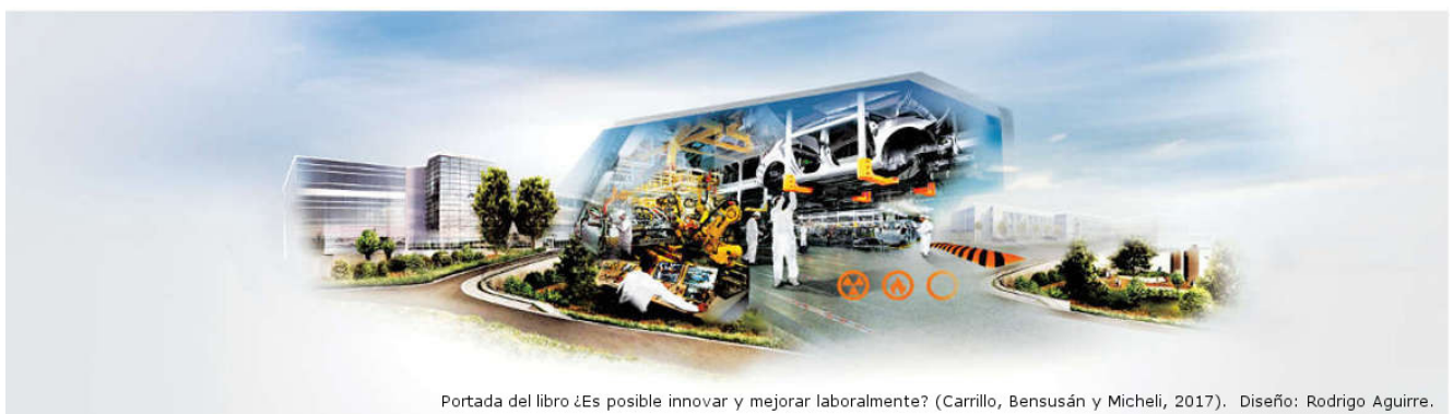
Portada del libro ¿Es posible innovar y mejorar laboralmente? (Carrillo, Bensusán y Micheli, 2017). Diseño: Rodrigo Aguirre.