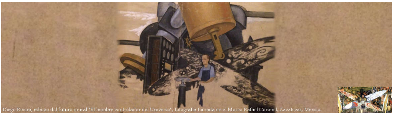
Diego Rivera, esbozo del futuro mural "El hombre controlador del Universo", fotografía tomada en el Museo Rafael Coronel, Zacatecas, México.