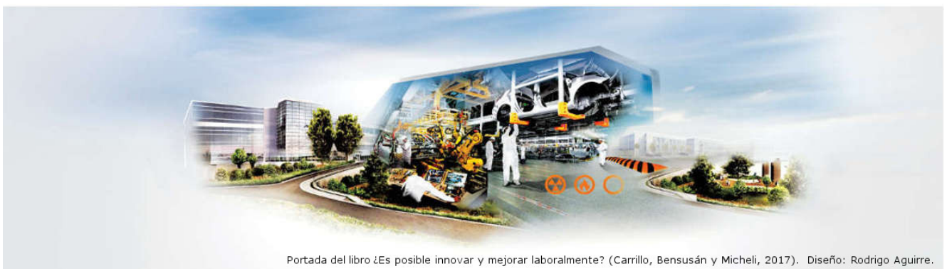
Portada del libro ¿Es posible innovar y mejorar laboralmente? (Carrillo, Bensusán y Micheli, 2017). Diseño: Rodrigo Aguirre.