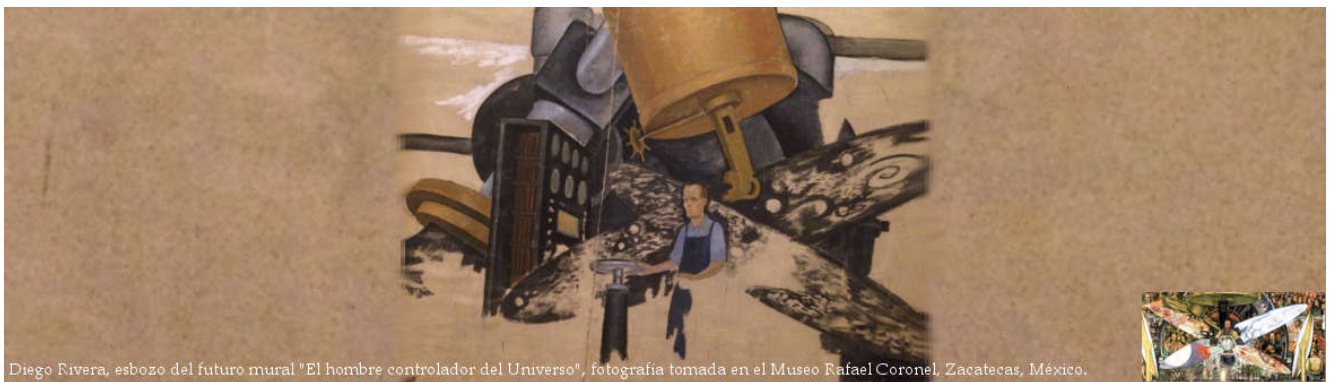
Diego Rivera, esbozo del futuro mural "El hombre controlador del Universo", fotografía tomada en el Museo Rafael Coronel, Zacatecas, México.