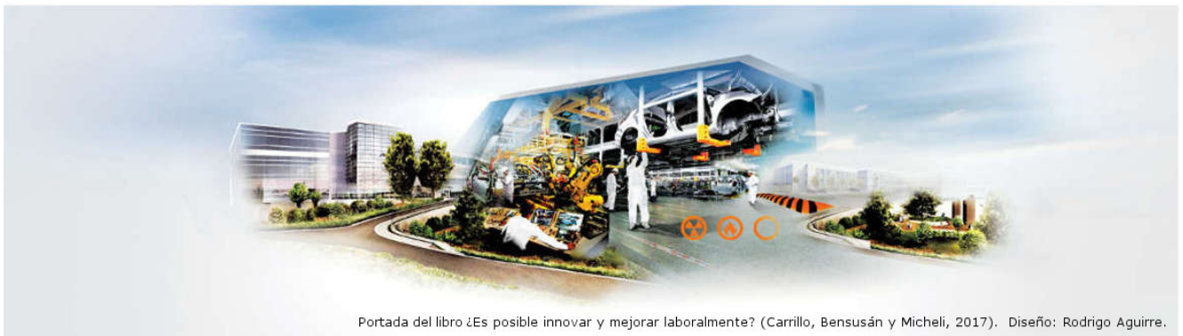
Portada del libro ¿Es posible innovar y mejorar laboralmente? (Carrillo, Bensusán y Micheli, 2017). Diseño: Rodrigo Aguirre.