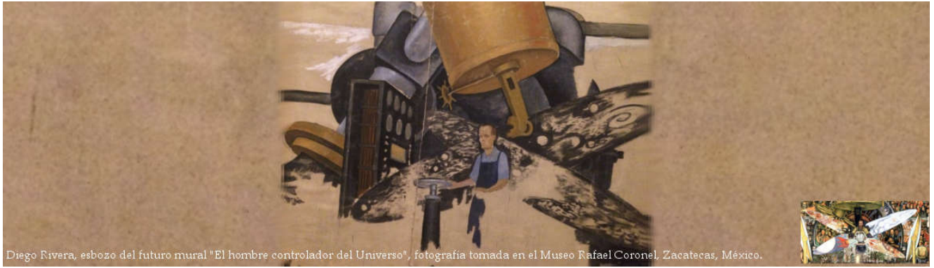
Diego Rivera, esbozo del futuro mural "El hombre controlador del Universo", fotografía tomada en el Museo Rafael Coronel, Zacatecas, México.