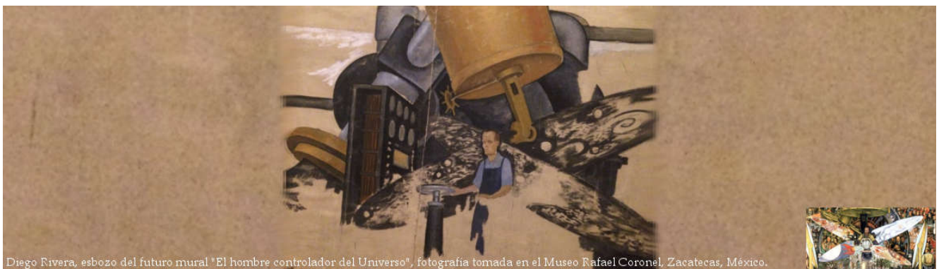
Diego Rivera, esbozo del futuro mural "El hombre controlador del Universo", fotografía tomada en el Museo Rafael Coronel, Zacatecas, México.