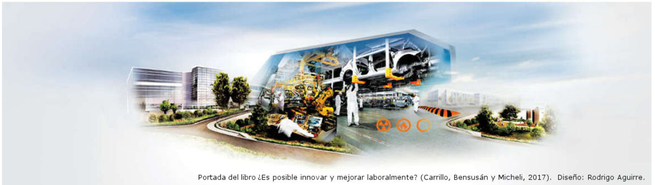
Portada del libro ¿Es posible innovar y mejorar laboralmente? (Carrillo, Bensusán y Micheli, 2017). Diseño: Rodrigo Aguirre.